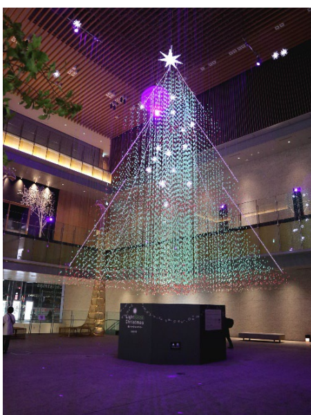
KITTE名古屋 暗がりのクリスマスツリー

寄贈先の中村区安心・安全で快適なまちづくり推進協議会を通じ、中村区の小学校15校の一年生を対象に令和5年2月20日（交通事故死ゼロを目指す日 (※3) ）に配布されます。このキーホルダーには、中村区の交通安全キャラクターである犬の「とみまつ (※4) 」が描かれています。