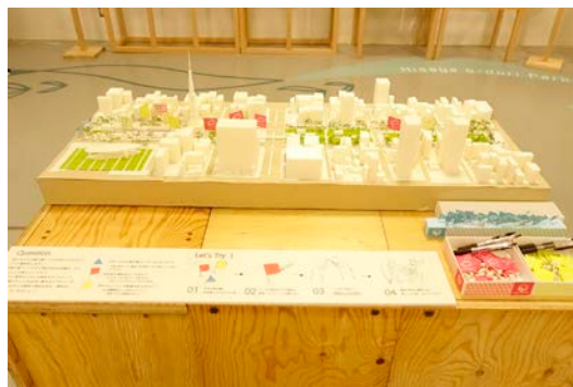
久屋大通公園周辺を再現した模型