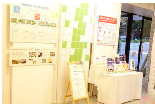
碁盤目状の企画説明パネル

概要：「碁盤目×ハッシュタグでつくる栄の未来」をコンセプトに、来場者が写真撮影を通して新たな町の姿を共同でつくるブースです。ブース内には、かつて城下町として碁盤目状に構成されていた久屋大通公園周辺を#(ハッシュタグ)に見立てパネルを配置。常備されたハッシュタグ「#ヒサヤで寄り道しよう」が記載されたカードを見て、そのハッシュタグを町の雑貨店やカフェ、風景等の写真に添えて SNS に投稿します。投稿された写真は碁盤目状にデザインされたパネルに印刷して貼られ、ブース内・SNS 上で新しい久屋大通公園周辺の魅力を発信・共有し合うことができます。