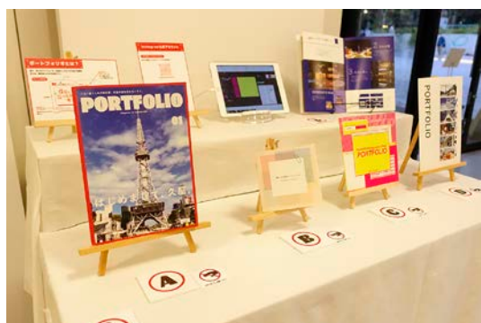
ポートフォリオサンプル

概要：学生同士がデザインの作品集を通して互いを高め合う展示「僕らのポートフォリオ展 2021（2021 年春開催予定）」のスピノフ企画で、「あなたの写真作品がポートフォリオになります」をコンセプトに、撮影した写真を作品集にできるブースです。来場者はブース内に設置されたポートフォリオサンプルから希望のものを選び、久屋大通公園周辺の写真をハッシュタグ「#僕らの久屋ポートフォリオ」とポートフォリオ記載のアルファベットを添えて SNS に投稿すると、「僕らのポートフォリオ展 2021」にて製本された状態で展示されます。自身の目に映るものを作品集として展示することで、来場者・「僕らのポートフォリオ展 2021」で展示をする学生が繋がり、互いが持つ自身だけの感性を共有し合い新しい視点・価値を体感します。