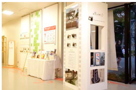
企画説明パネル兼フォトスポット

概要：「栄の魅力をのぞく」をコンセプトとした、来場者が写真撮影を通して町の魅力を体感できるブースです。ブース内に常備されたオリジナルフレームを使って栄の町をのぞき、フレームを通して撮影した写真をSNS上で共有し合うことで、栄の魅力やそれぞれの目に映る新たな町の姿を発見し合います。