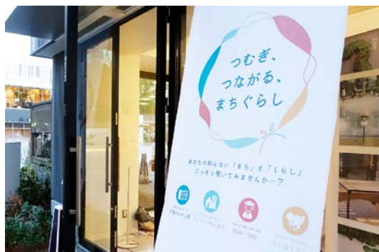
「つむぎ、つながる、まちぐらし」

今回は名古屋市の学校・学生団体と共同で取り組み、学生たちは展示イベント「つむぎ、つながる、まちぐらし」の企画の基盤考案と、展示内ブース「久屋大通公園から魅力発信 SUGU・SOKO」の企画・デザインを行い、当社はディレクションや設計・施工等を担当しました。