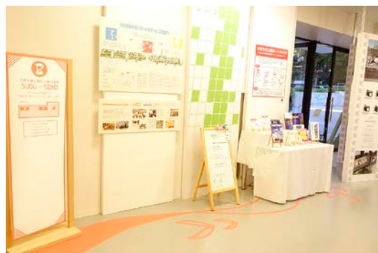
「久屋大通公園から魅力発信 SUGU・SOKO」

※展示イベントではアルコール消毒液の設置・換気の徹底等、感染症対策を実施いたしました。