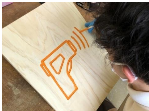
学生の手描きで作成

今回の什器は複雑な形にも対応できるよう、強度のあるヒノキを使用し制作しました。ヒノキを使用したことで斜めの形にも組み立てることができました。組み立て式のため、簡単に什器を分解することができ運搬に適したものとなりました。