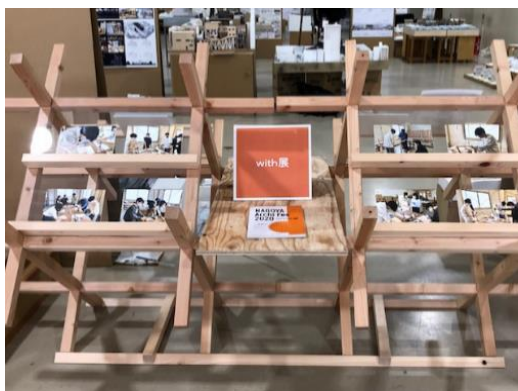
学生と話し合いを重ねて制作した什器

当初、学生が希望した什器は設計が複雑で、強度や費用等の問題もありました。しかし、当社の社員と学生の間で何度も話し合い、現実的な予算や制作手法を導き出して完成にたどり着くことができました。