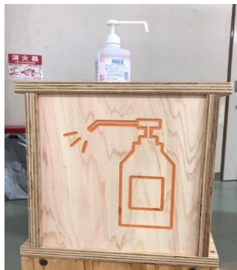
アルコール消毒液のサイン

来場者に検温とアルコール消毒への協力を促すサイン。遠くからでも消毒液の設置場所がすぐに分かるデザインにするなど、学生のアイデアが活かされています。