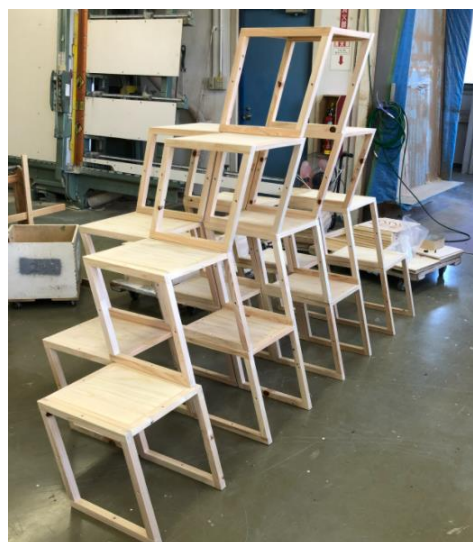
強度の問題をクリアし斜めの形にも組み立てが可能に